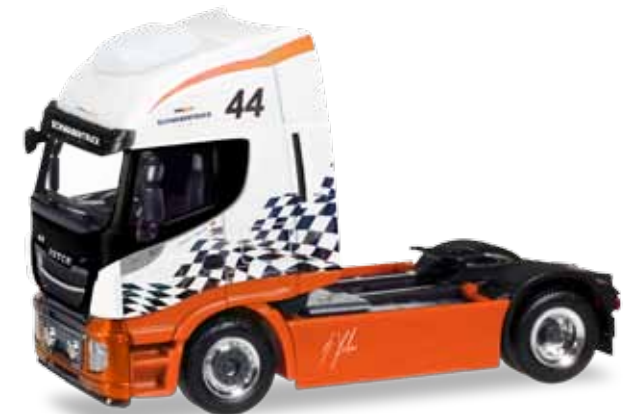
309141 Iveco Stralis Highway XP, weiß / white